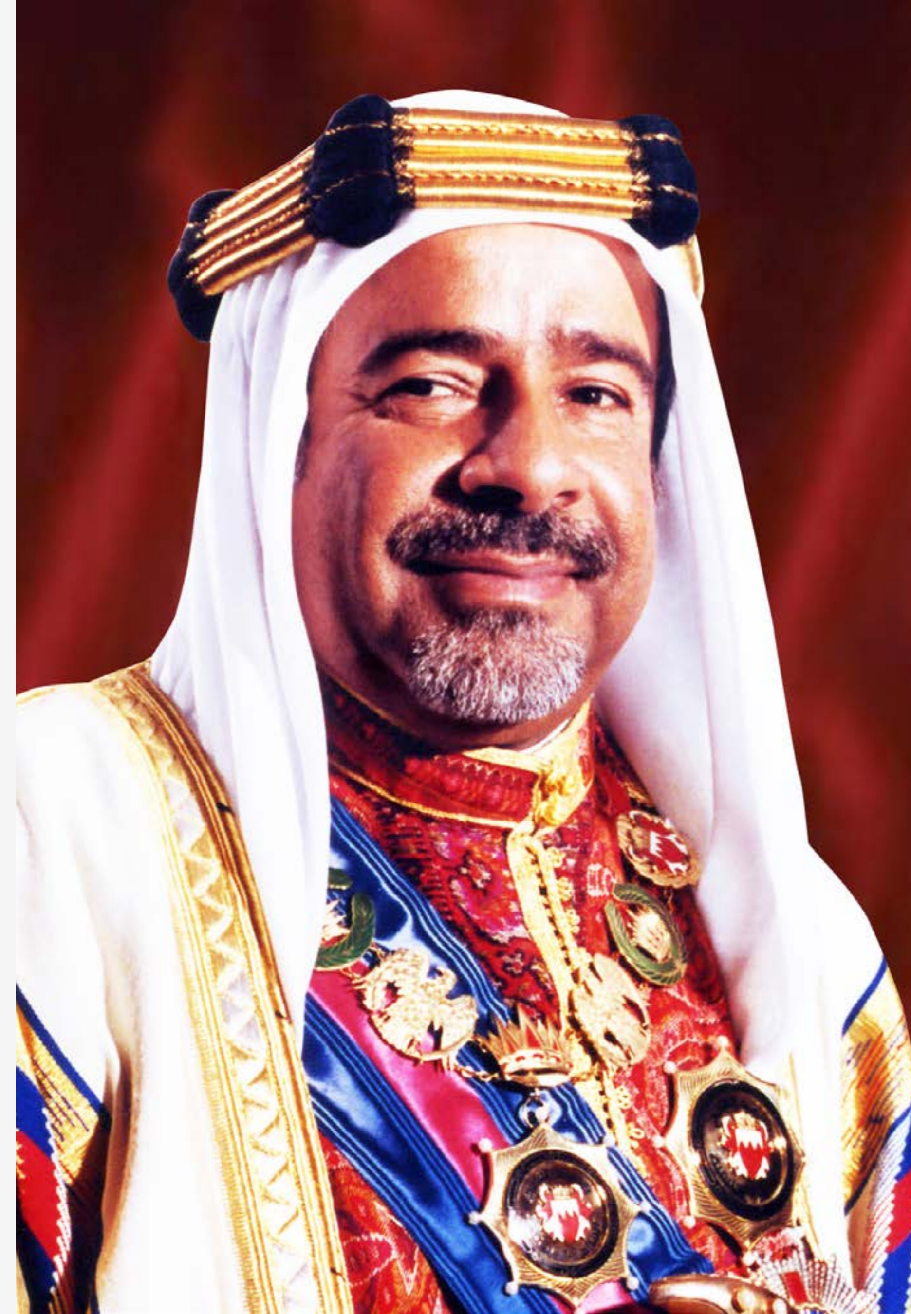
المغفور له بإذن الله تعالى صاحب السمو الشيخ عيسى بن سلمان آل خليفة أمير البلاد الراحل