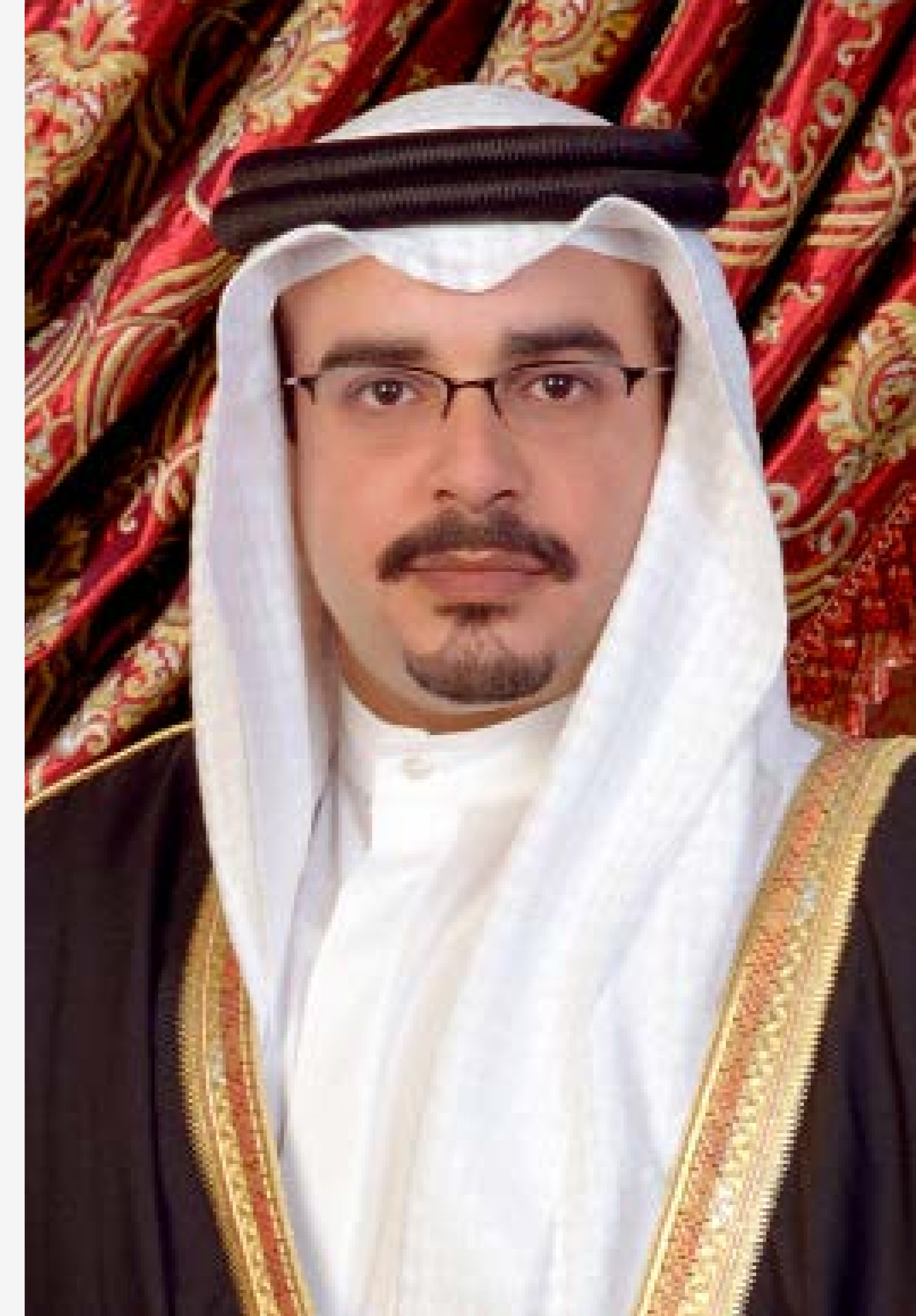
صاحب السمو الملكي الأمير سلمان بن حمد آل خليفة ولي العهد رئيس مجلس الوزراء