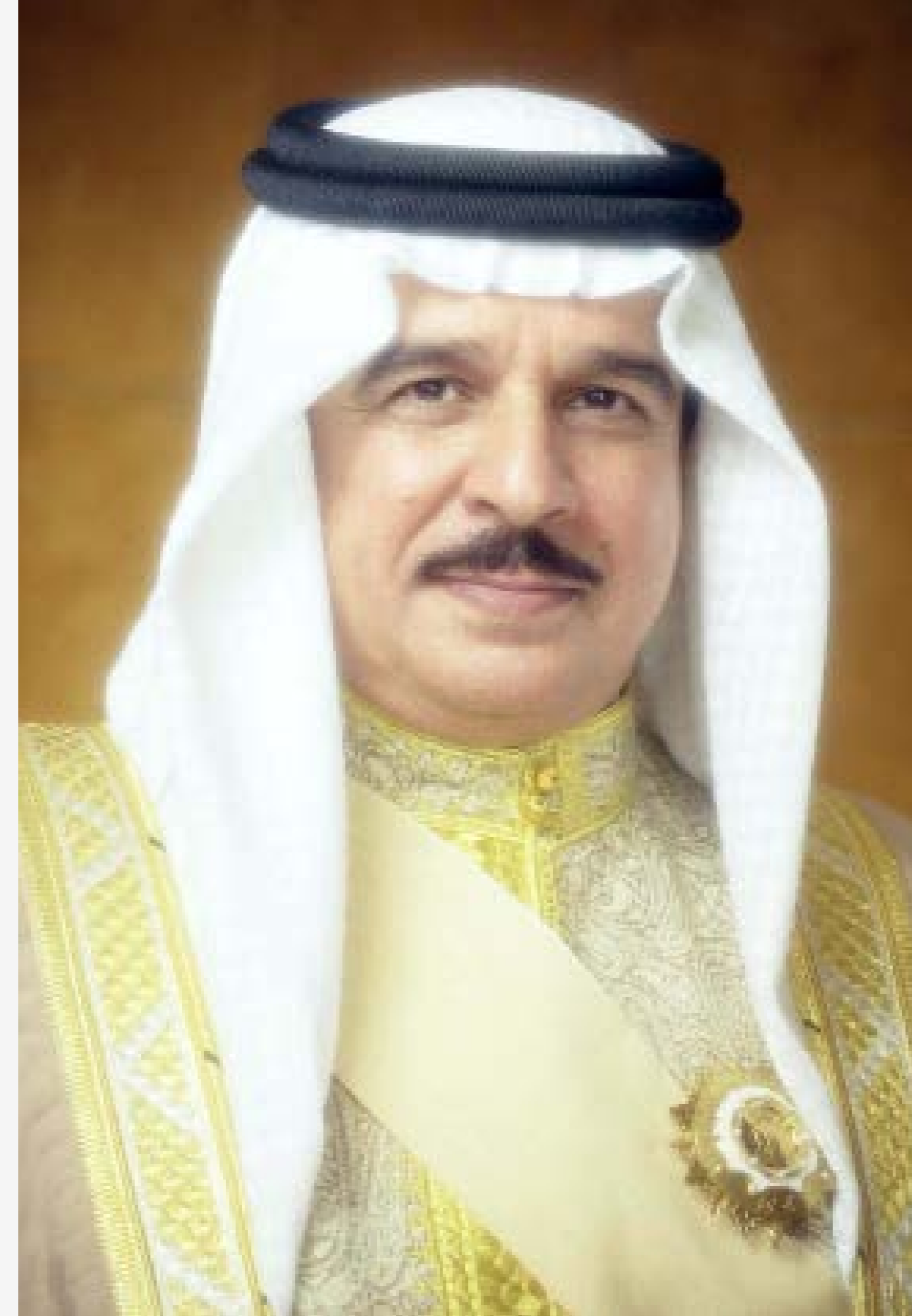
حضرة صاحب الجلالة الملك حمد بن عيسى آل خليفة ملك مملكة البحرين